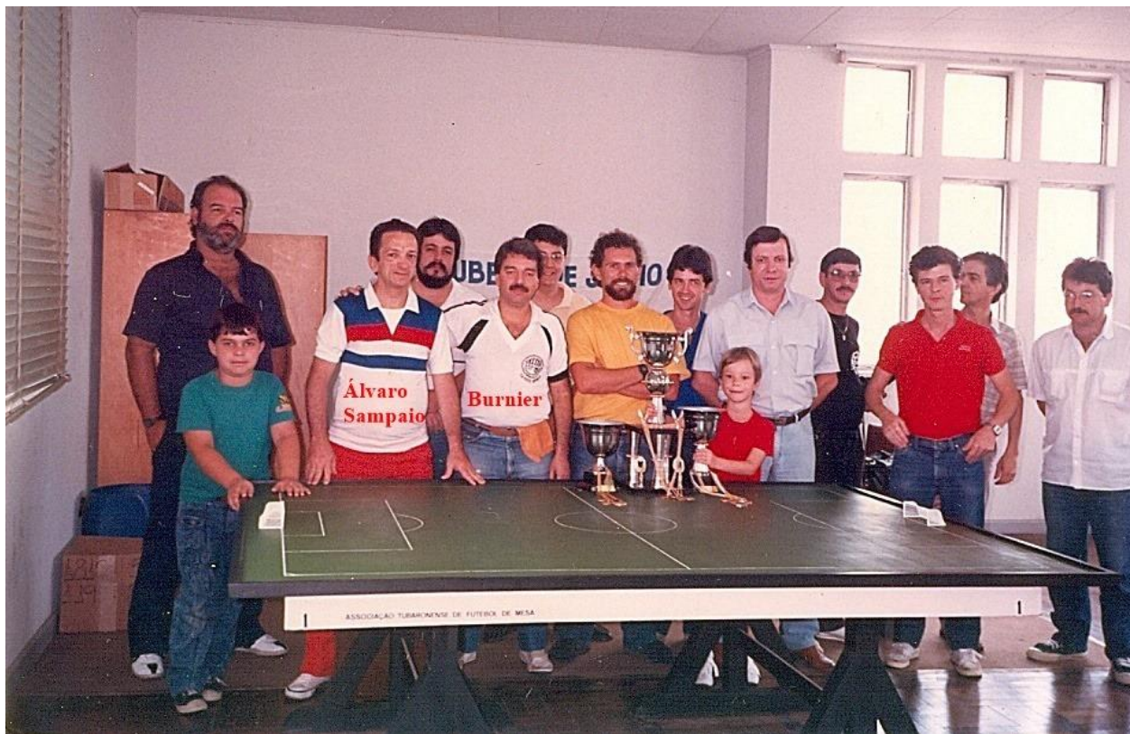
Participantes e organizadores do VI Campeonato Sul-Brasileiro de Futebol de Mesa - 3 Toques

Foi realizado na cidade de Tubarão (SC), de 20 a 22 de novembro de 1987, o VI Campeonato Sul-Brasileiro de Futebol de Mesa, com a participação de 24 botonistas das cidades de Curitiba (PR), Florianópolis (SC), Joinville (SC), Cachoeira do Sul (RS), Porto Alegre (RS), Tubarão (SC) e convidados do Rio de Janeiro (RJ), Belo Horizonte (MG) e Brasília (DF).